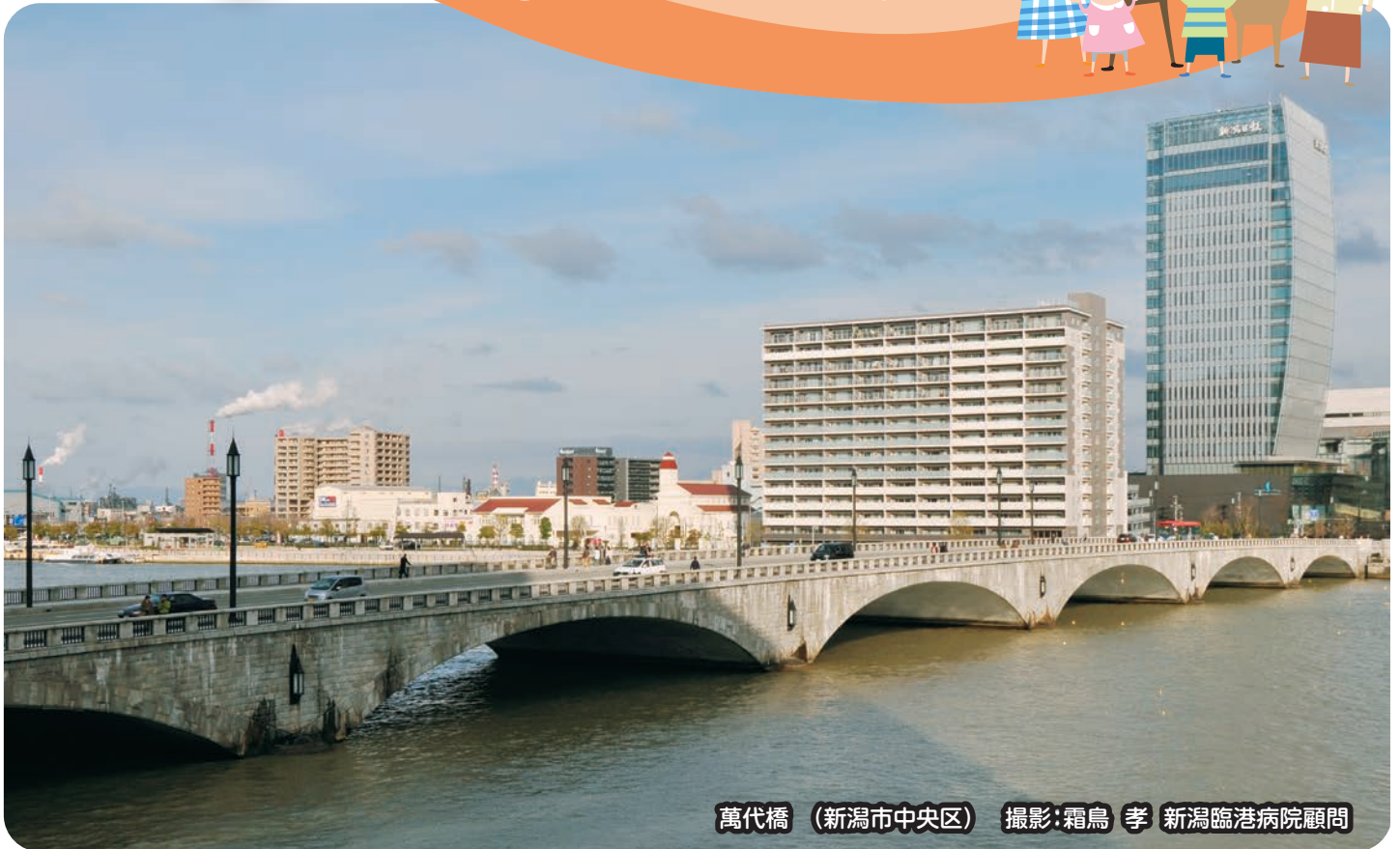
萬代橋 (新潟市中央区)