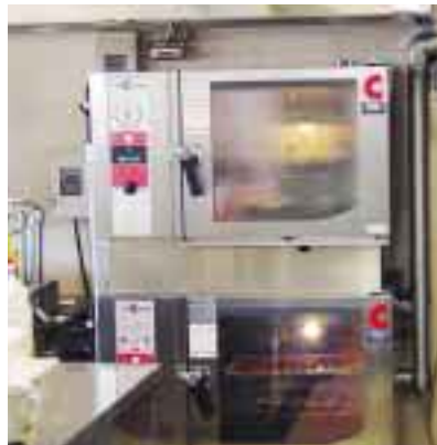
スチームコンベクション

明日はセレクトメニューの日だ!! 全員がんばります。今回は栄養科の2大仕事のうちのフードサービス分野についての紹介でした。