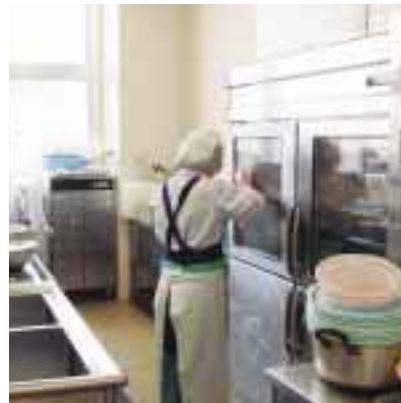
独立した下ごしらえ室

早朝6時から早番4名、朝食作りに奮闘しています。時間との戦いです。中番2名9時から昼食そして夕食作りにとりかかります。常食、全粥、7分粥、5分粥、3分粥、流動食、糖尿病食、腎臓病食、それに肉嫌い、魚嫌い、卵嫌い、きざみ、ミキサー等々一言では言えないくらい種々雑多、でもOKです。張り切って作っています。遅番10時より1名食料の計量、お膳・食札の揃えなど明日の準備をし、火の元確かめ施設し、夜7時30分帰宅。その他に毎日公休3名、洗浄パート5名、調理パート1名、管理栄養士2名事務員1名（派遣）の計19名のスタッフです。